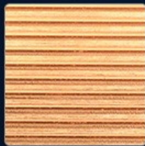
Efficient heat sink