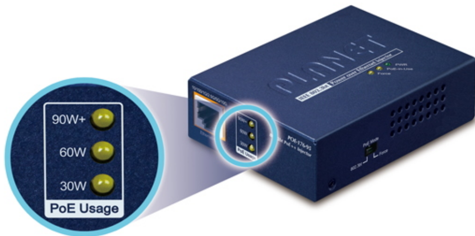
PoE Power Usage Display