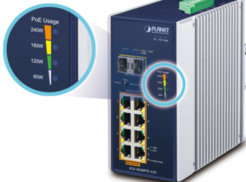
PoE Power Usage Display

ČSN EN 61000-4-11:2004 - Krátkodobé poklesy napětí, krátká přerušování a pomalé změny napětí